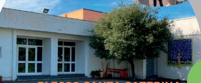
PLESSO SANTA CATERINA